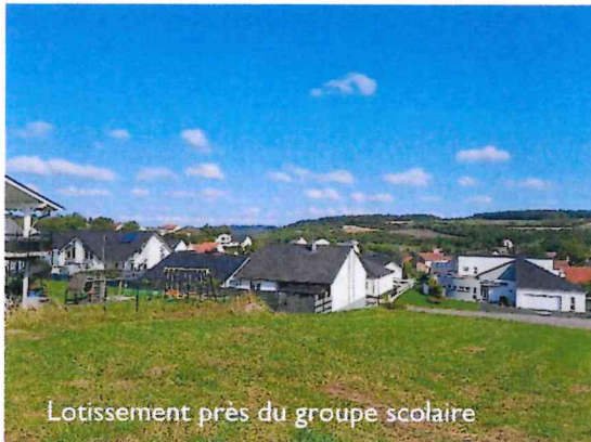
Lotissement près du groupe scolaire