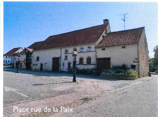
Place rue de la Paix