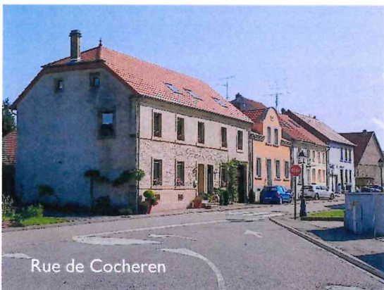
Rue de Cocheren