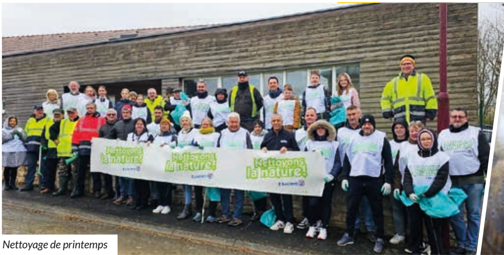
Nettoyage de printemps