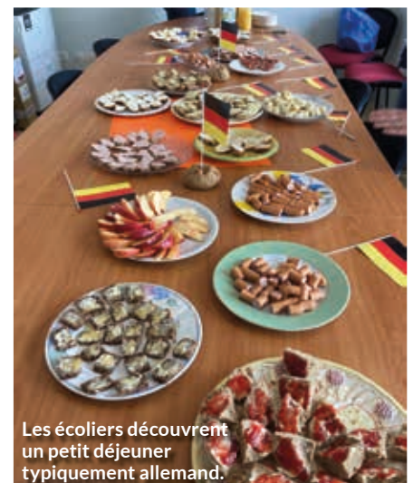
Les écoliers découvrent un petit déjeuner typiquement allemand.