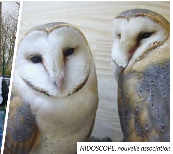
NIDOSCOPE, nouvelle association