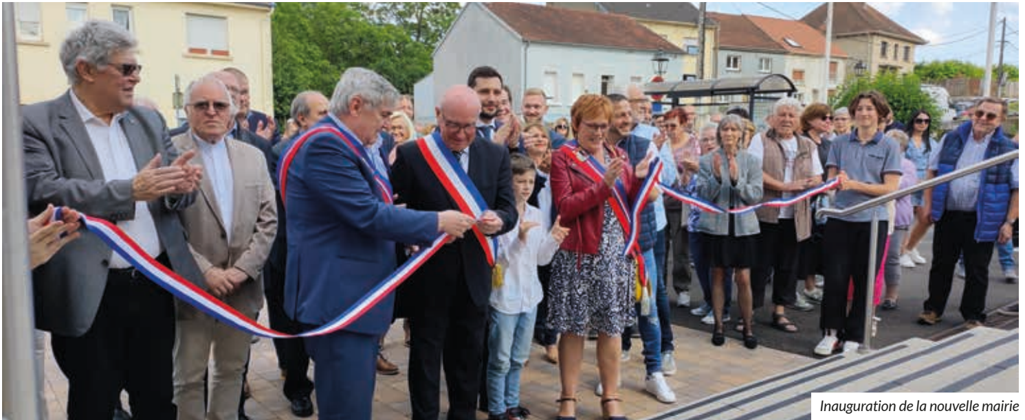
Inauguration de la nouvelle mairie